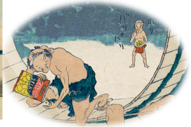
しりあがり寿「ポテトチップス六景 虫メガネで大きくすると……」©しりあがり寿 すみだ北斎美術館蔵(通期)