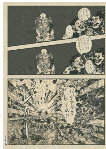
しりあがり寿「いきなりピーム」©しりあがり寿 すみだ北斎美術館蔵(通期)

北斎サンの絵にも現代のマンガに通じる効果線が使われています。コマ割りしてセリフを入れたら、もう週刊マンガ誌の1ページにしか見えません。