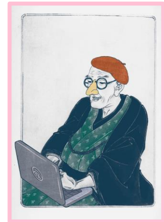
しりあがり寿「しりあがり寿肖像画」(溪斎英泉「北齋肖像画」国立国会図書館デジタルコレクション使用)

1981年多摩美術大学グラフィックデザイン専攻卒業後、食品メーカーでデザイン、広告、商品開発等をてがける。1985年単行本『エレキな春』で漫画家デビュー。1994年独立後はマンガ、イラストなどに幅広く活動。2016年に「しりあがり寿の現代美術 回・転・展」(練馬区立美術館)、2018年「ちよつと可笑しなほぼ三十六景 しりあがり寿北齋と戯れる」展(すみだ北齋美術館)、2020年「古典×現代 2020—時空を超える日本のアート」(国立新美術館)に出展、現代美術にも活動の幅を広げている。2011年、東日本大震災や原発をテーマにした『あの日からのマンガ』で文化庁メディア芸術祭マンガ部門優秀賞を受賞。2014年、紫綬褒章受章。