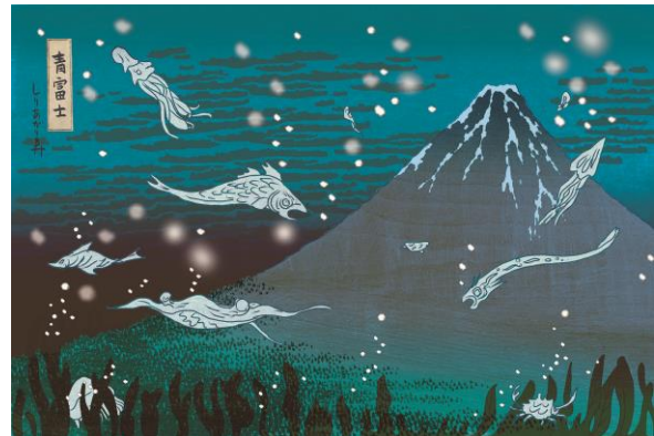
左 | 葛飾北斎「富嶽三十六景 凱風快晴」すみだ北斎美術館蔵(後期) 右 | しりあがり寿「ちょっと可笑しなほぼ三十六景 青富士」©しりあがり寿 すみだ北斎美術館蔵(通期)