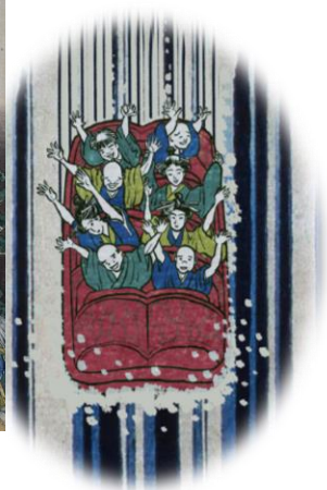
左 | 葛飾北斎「諸国瀧廻り 美濃ノ国養老の滝」すみだ北斎美術館蔵(後期) 右 | しりあがり寿「諸国瀧廻り アトラクション」©しりあがり寿 すみだ北斎美術館蔵(通期)