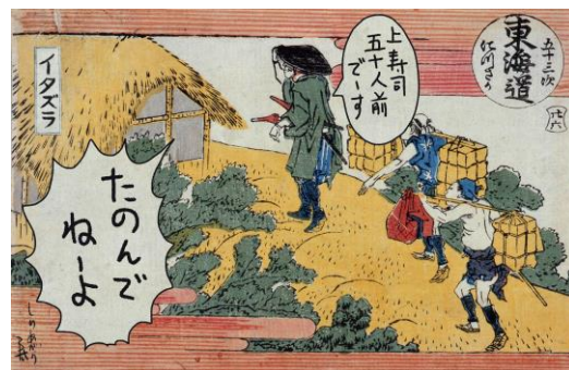
左 | 葛飾北斎「五十三次江都の往かい につさか」すみだ北斎美術館蔵(前期)