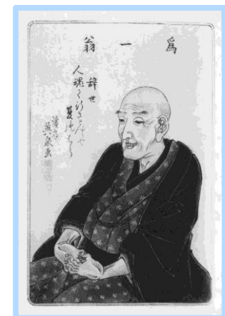
溪斎英泉「北齋肖像画」国立国会図書館デジタルコレクション

本所割下水(現在の墨田区北齋通り)付近で生まれる。生涯に引越しを93回したと伝わるが、多くの時間をすみだで過ごした。勝川春章に入門し勝川春朗を名乗った後、勝川派を離れ江戸琳派の頭領である俵屋宗理を襲名。独立後、北齋の名で活動したが、そのあとも改名を繰り返し、生涯で使用した画号は30にのぼるといふ。幅広いジャンルの作品を手掛けたが、浮世絵に風景画のジャンルを確立させたことや、読本挿絵の芸術性を飛躍的に高めたことは大きな功績の1つである。主な作品に、「富嶽三十六景」、「北齋漫画」など。